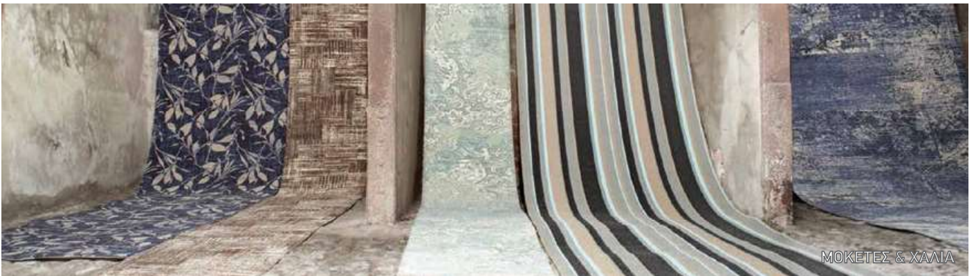
ΜΟΚΕΤΕΣ & ΧΑΛΙΑ