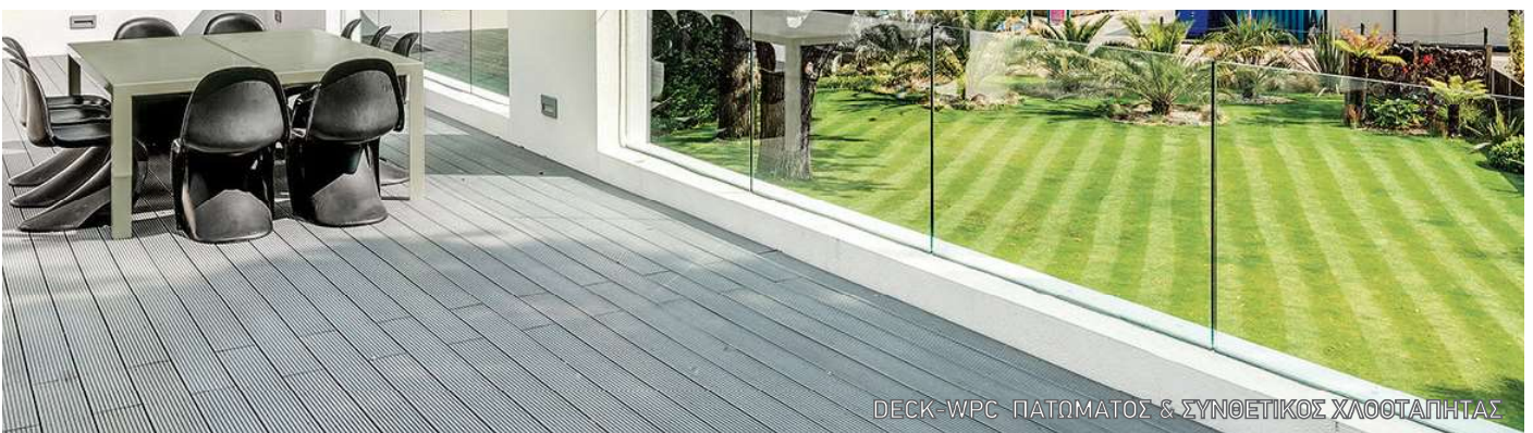
DECK-WPC ΠΑΤΩΜΑΤΟΣ & ΣΥΝΘΕΤΙΚΟΣ ΧΛΟΣΤΑΠΗΤΑΣ