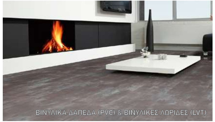
ΒΙΝΥΛΙΚΑ ΔΑΠΕΔΑ (PVC) & ΒΙΝΥΛΙΚΕΣ ΛΩΡΙΔΕΣ (LVT)