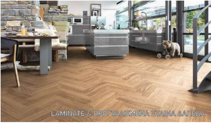
ΛΑΜΙΝΑΤΕ & ΠΡΟΓΥΛΙΣΜΕΝΑ ΞΥΛΙΝΑ ΔΑΠΕΔΑ